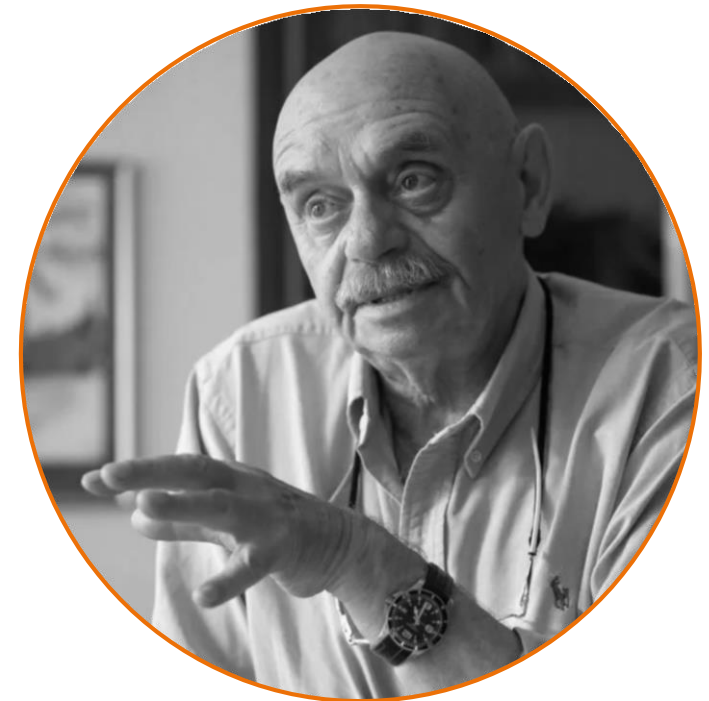
Народный учитель России Ефим Лазаревич Рачевский