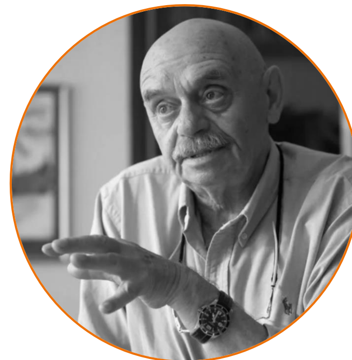
Народный учитель России Ефим Лазаревич Рачевский