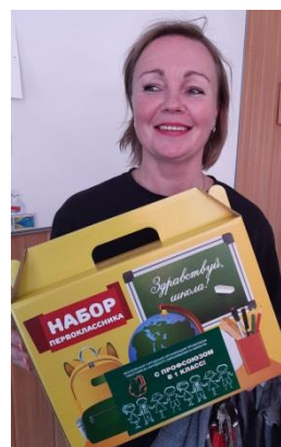
Подарки родителям первоклассников

К праздникам (Новый год, День учителя, 23 февраля, 8 марта) все члены ППО получили подарки и подарочные сертификаты от профкома школы. Общая сумма подарков составила 387 тыс. рублей.