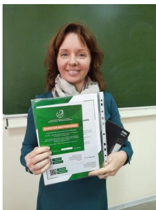
Подарки родителям выпускников

Дети членов профсоюза, поступившие в педагогические вузы на учительские специальности, получают единоразовую стипендию. Выпускница нашего члена профсоюза получила 50 тыс. рублей.